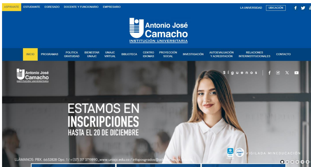
Home Página web Institucional UNIAJC

http://www.uniajc.edu.co/transparencia-y-acceso-a-informacion-publica/