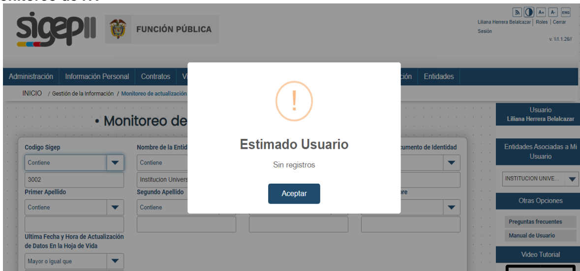
Captura de Pantalla sistema SIGEP II Rol Control Interno