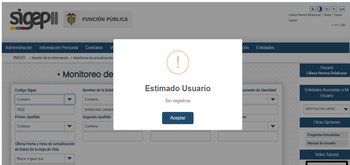
Captura de Pantalla sistema SIGEP II Rol Control Interno.