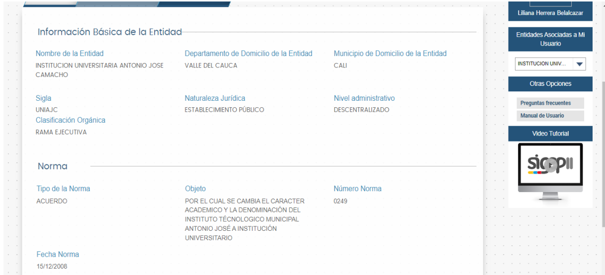
Captura de Pantalla sistema SIGEP II Rol Control Interno

Link documento soporte: DetalleInformaciónEntidadINSTITUCION UNIVERSITARIA ANTONIO JOSE CAMACHO-29112022.pdf